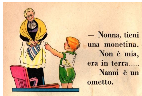
Illustrazione tratta da "il libro della prima classe", compilato dalla signorina Maria Zanetti, illustrato da Enrico Pinocchi, La libreria dello Stato, 1937.